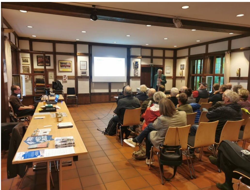
Abbildung: Eine Folie vom Vortrag im Oktober